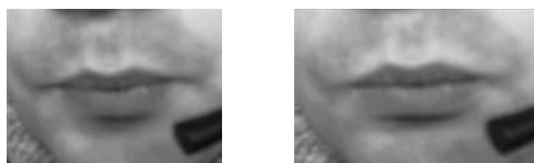
3 pav. Vizemos „b“ žodyje „bėga“ ir „boikotas“

Taip pat galima pastebėti, kad tos pačios fonemos vizemos, esančios skirtingose pozicijose (padėtis atsižvelgiant į prieš ir po einančias fonemas), gali gerokai skirtis. Tokį konkretų pavyzdį galima pamatyti 3 paveiksle. Taip yra todėl, kad tos pačios fonemos vizema priklauso nuo toliau esančių fonemų.